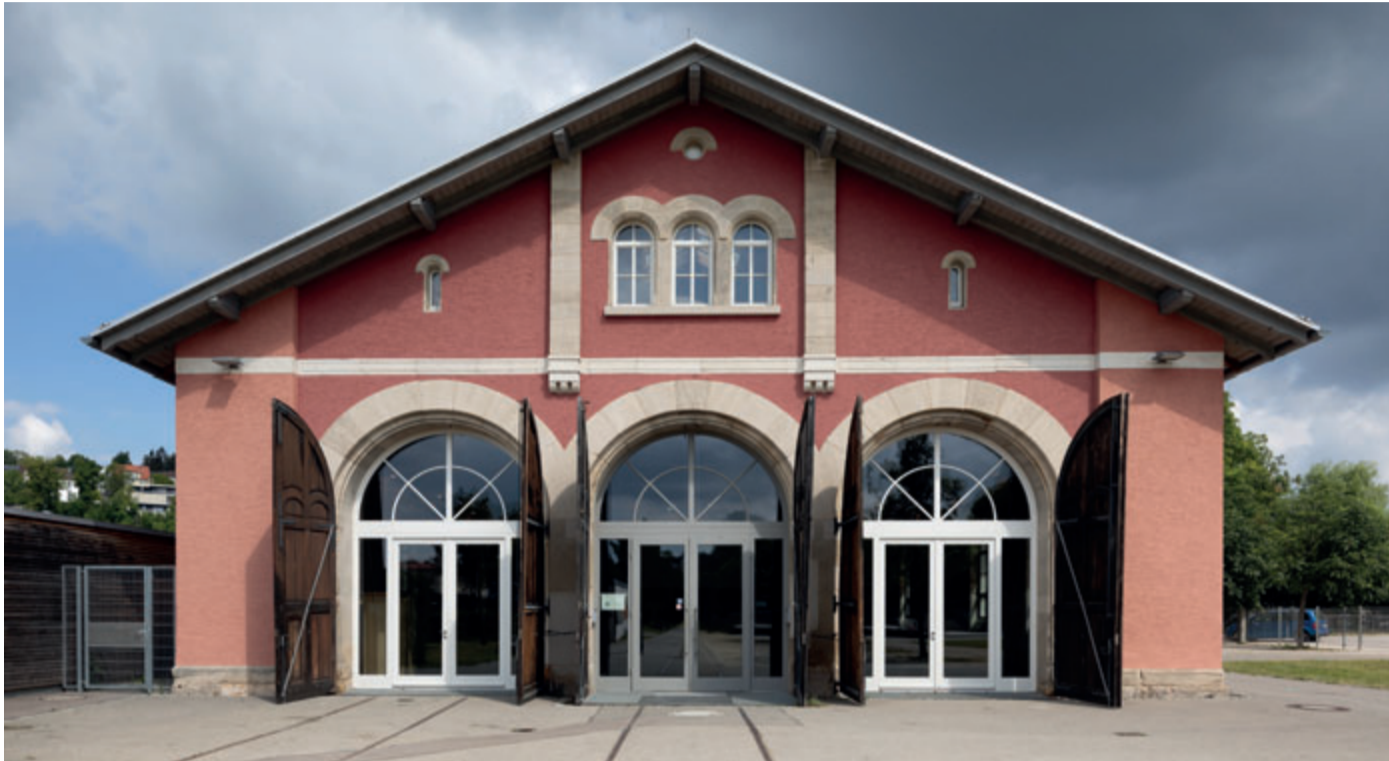
Direkt am Fluss Brenz gelegen, dient der 1864 eingeweihte Lokschuppen heute als Event-Lokal.

Der Lokschuppen in Heidenheim ist ein beliebter Veranstaltungsort. Das hinterlässt Spuren – vor allem auf dem Boden. Dank einer Spezialbeschichtung durch die Fachhandwerker vom HS-Standort Aalen soll er dem Besucheransturm künftig besser standhalten