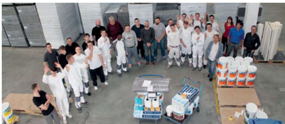
Ausbilder, Lehrlinge, Führungskräfte – rund 30 Teilnehmer kamen für das neu eingeführte Azubi- und Ausbildertreffen nach Leipzig.