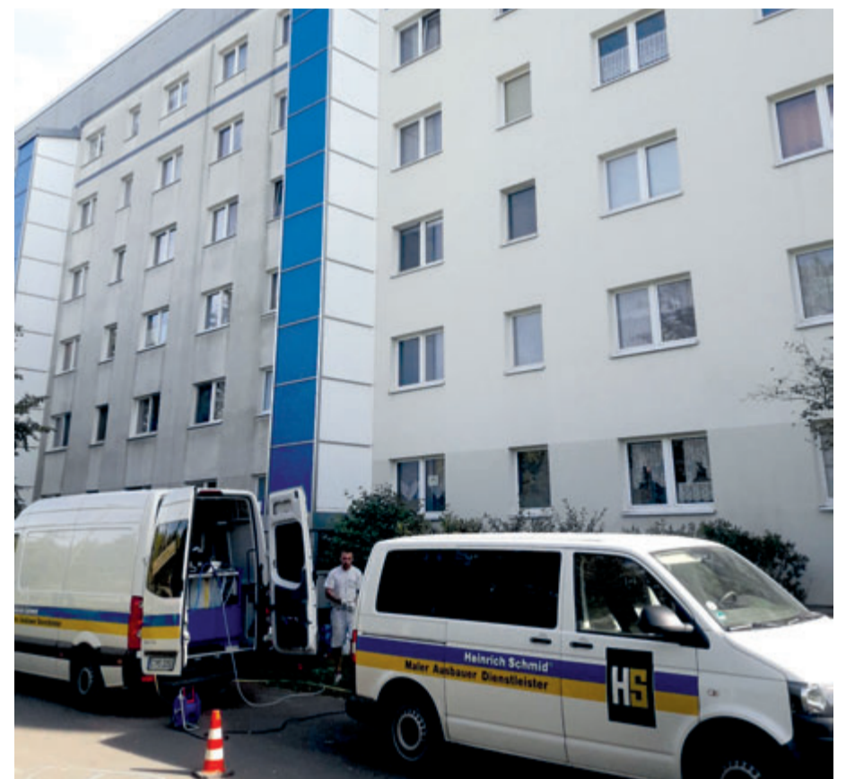
Vorher (links) und nachher (rechts): Auch an diesem Wohngebäude in Leipzig haben die Chemnitzer Fassadenreiniger gearbeitet. Mit deutlichem Ergebnis.