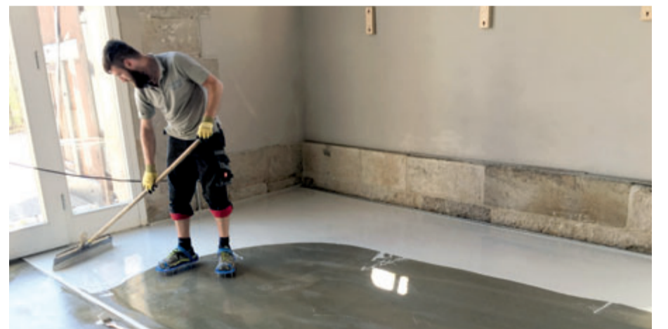
Die Fachhandwerker brachten mit einer Flächenraket die Zwischenbeschichtung auf.