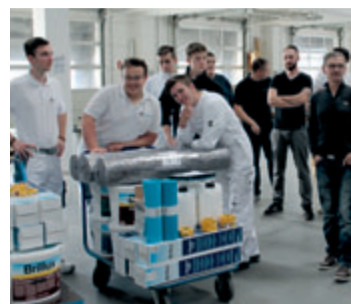
Abläufe lernen: Zunächst ermittelten die Lehrlinge das nötige Material für ihre Baustellen (links), forderten es selbstständig über das Telefon an – und bekamen es dann auch geliefert (rechts).