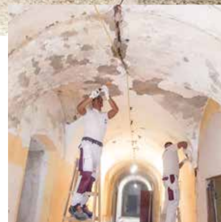
Viel Geduld, Kraft und Technik waren nötig, um die historischen Untergründe für die neue Gestaltung vorzubereiten.

Im einstigen Kirchenschiff montierten die Mitarbeiter zudem ein modernes Akustiksystem. Zu guter Letzt wartete auf das Linzer Team noch der Keller des Gebäudes. Dort sollte ein kleines Fernsehstudio entstehen. „Wir nutzten als Farbe ein spezielles Chromakey-Grün, außerdem mussten wir alle Ecken im Raum mit Hohlkehlen ausbilden, damit sie später bei Film- aufnahmen unsichtbar sind“, berich-