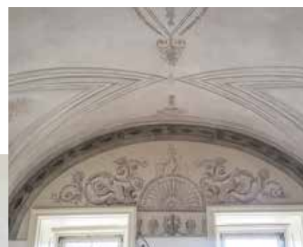
Detailarbeit: In den Gebäuden warteten zahlreiche Stuckelemente und Gewölbedecken.