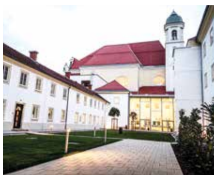
Hell und nach historischem Vorbild: Auch für die Gestaltung der Fassaden waren die Hauser-Mitarbeiter zuständig.