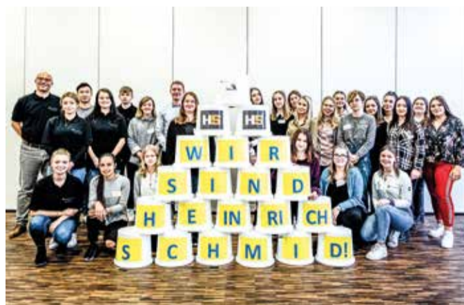
Die kaufmännischen Auszubildenden des Jahrgangs 2019.

Besuch beim Begrüßungstag der kaufmännischen Azubis