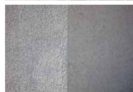
Mit einer Reliefwalze erzeugten die Stuckateure die grobe Struktur des Fassadenputzes.