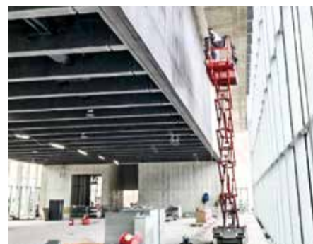
Airliss in luftiger Höhe: Marcel Herzog bei der Lasur des Sichtbetons. Der Farbauftrag erfolgte im Kreuzverfahren.