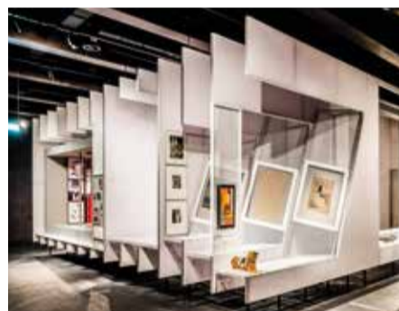
Die schwarzen Decken, Böden und Wände bringen die Ausstellungselemente im Innern ideal zur Geltung.