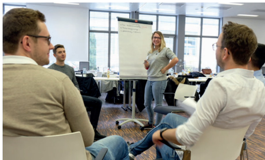
Die Dualen Studenten erörtern Leitfragen zu „Werten und Verhalten“.