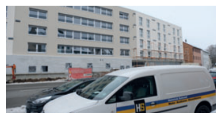
Der Neubau des Altersheims in Tuttlingen war eines der ersten Großprojekte für den neuen HS-Satelliten in Tuttlingen.

den bisherigen Projekten zählen auch Schulen und ein Krankenhaus. Ein Jahr nach dem Start – wie lauten die weiteren Pläne? Menzel: „Unsere Räumlichkeiten hier sind zukunftsorientiert, es gibt Platz für weiteres Wachstum. Darauf setzen wir und suchen gute Leute, auf die wir bauen können.“