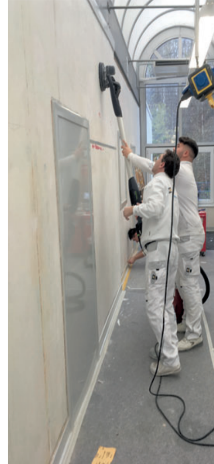
Schnuppertage, Messeauftritte, Trainings in der Lehrwerkstatt: Schnappschüsse der Ausbildungsarbeit in Nordrhein-Westfalen.

bei den Trainings in der Lehrwerkstatt. Zu denen können wir jetzt mehr Lehrlinge als bisher einladen. Sie hat einen super Draht zu den Mädels und Jungs.“ Wesenberg: „Der Maler steht den ganzen Tag vor der Wand und pinselt ein bisschen herum – so sehen manche Lehrer und Eltern unseren Beruf. Also mache ich Schnuppertage in Schulen: Ich will zeigen,