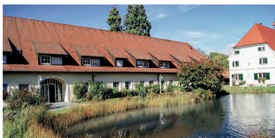
Geschichtsträchtig: Manche Gebäude des Weinstetter Hofes stammen aus dem 16. Jahrhundert.

Nächstes Fachseminar: am 18. Oktober zum Thema „Nachträgliche Abdichtung von undichten Betonbauwerken“. Einen Überblick über die Kulturveranstaltungen und Infos zur Geschichte des Hofes finden Sie unter www.weinstetter-hof.de .