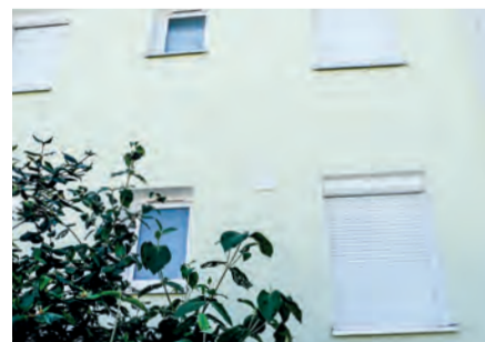
... und nach der Behandlung.