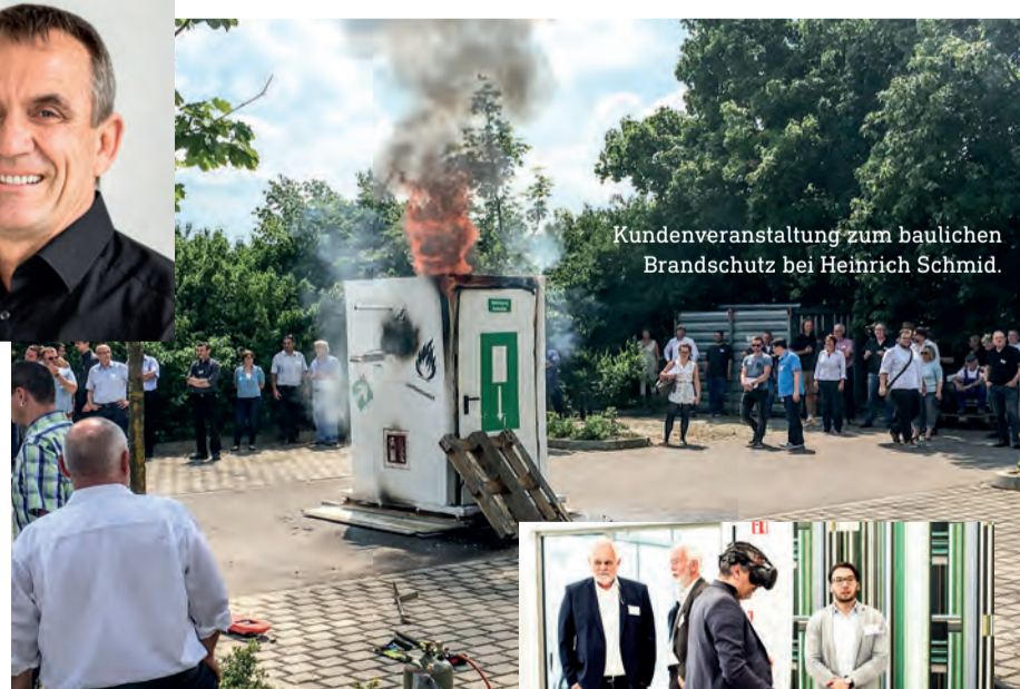
Kundenveranstaltung zum baulichen Brandschutz bei Heinrich Schmid.

beim Kunden muss zum Ritual werden. Am besten, indem man im Alltag Freiräume schafft, zum Beispiel jeden Donnerstagvormittag dafür reserviert. Wichtig ist ein langer Atem, kontinuierlich dranzubleiben, auch wenn ein erster Kontakt keinen Auftrag bringt. Es geht darum, stets für seine Kunden da zu sein, sie über Neues zu informieren, schnell auf ihre Wünsche zu reagieren und Mehrwert zu schaffen.