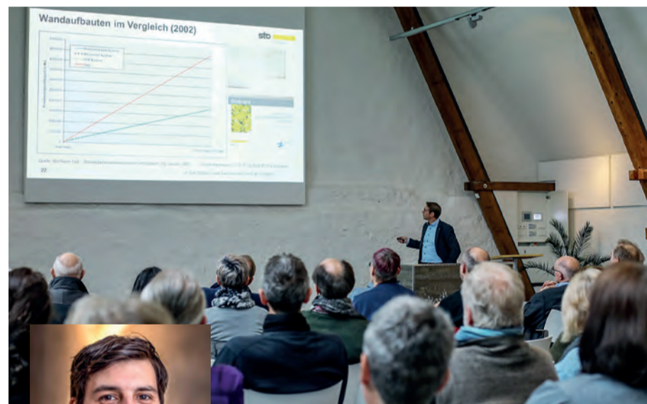
Ort des Wissens: Zu den Fachseminaren auf dem Weinstetter Hof kommen zahlreiche Kunden.

Der Weinstetter Hof, Sitz des Heinrich-Schmid-Standorts Eschbach, beeindruckt durch sein Ensemble historischer Gebäude. Das ist nicht der einzige Grund, warum er so viele Besucher anzieht