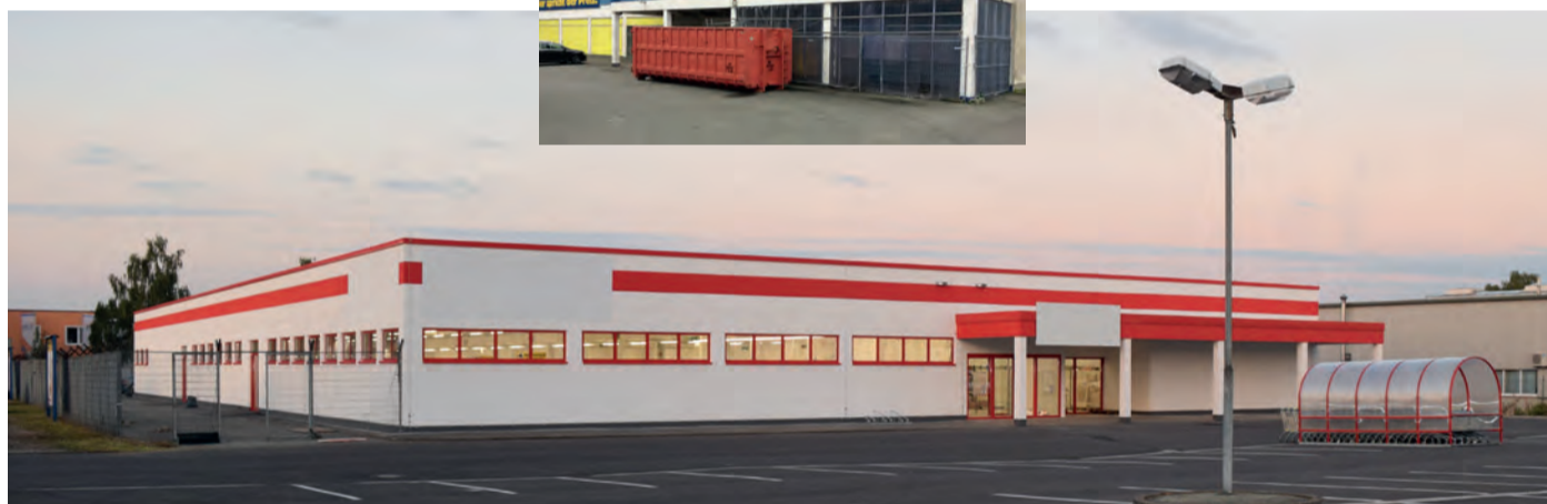
Vorher – nachher. Der Kunde investiert in leer stehende Bestandsgebäude. Diese sehen unterschiedlich aus. Doch die Heinrich-Schmid-Mitarbeiter sorgen für ein CI-konformes Aussehen – deutschlandweit.